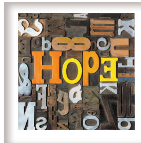
"Hope", 47 x 47 cm