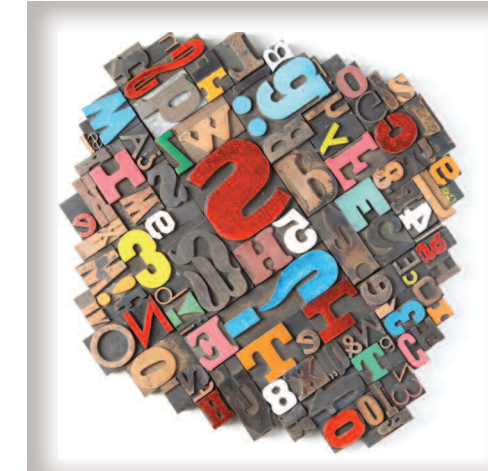
"Rotes S", 47 x 47 cm