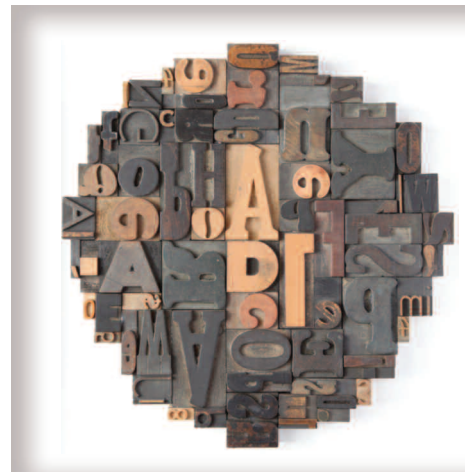
"AD 1", 37 x 37 cm