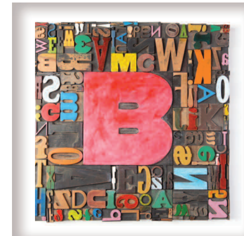
"Rotes B", 57 x 57 cm